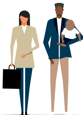
Werkende/niet werkende mantelzorgers van 25 tot 67 jaar