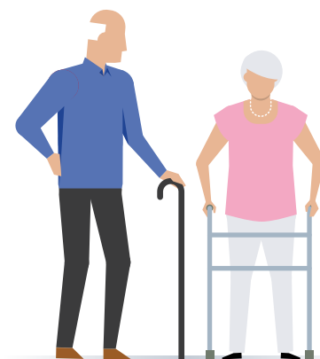
Oudere mantelzorgers 67 jaar en ouder